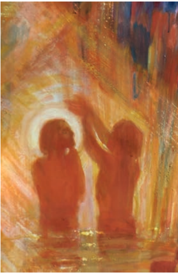
Jesus blir døpt av Johannes døperen.